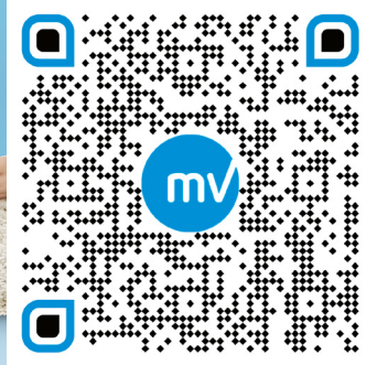
MV Mobilrechner im Partnernetz

This image shows a blank sheet of white paper with horizontal ruling lines. The lines are evenly spaced and run across the width of the page. There are no margins or other markings on the paper.